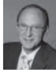
Herbert Jäger 1. Bürgermeister